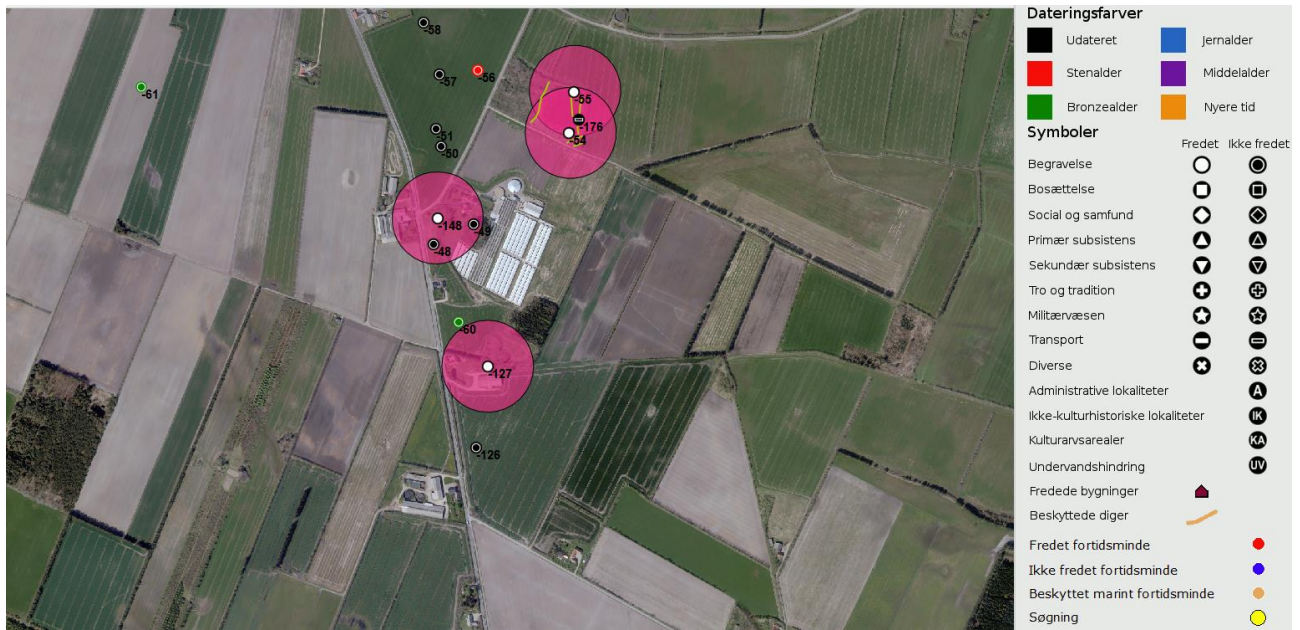
Figur 1: Udtræk fra fund og fortidsminder